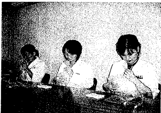
写1. 臭気指数測定風景(環境・排出口試料)

袋の代わりにフラスコを、無臭空気の代わりに無臭水を用いて②と同様な操作を行い、臭気指数を求めます。