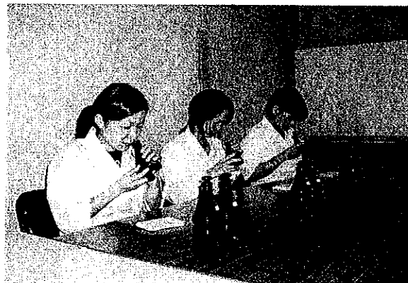
写2. 臭気指数測定風景(排水試料)